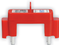
RCD-Messbrücke Plus V0.3 mit höherem Berührungsschutz